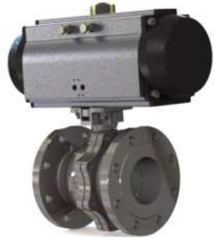
图 1. BV1001 型球阀配气动执行机构